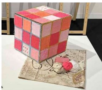
成果発表試作（西陣織）