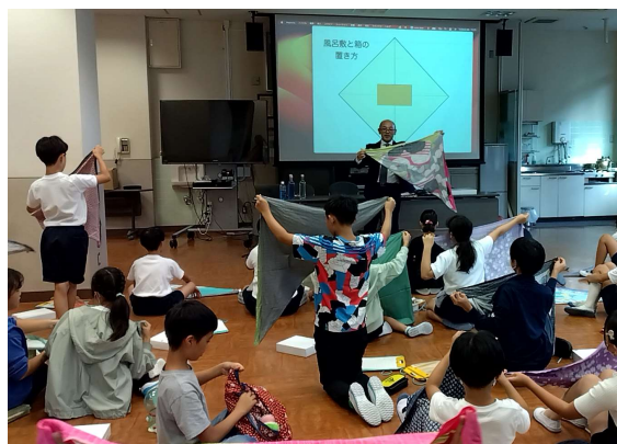
授業へ講師派遣（京都市立南大内小学校）