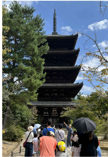
子どもの伝統体験教室と特別拝観（仁和寺）