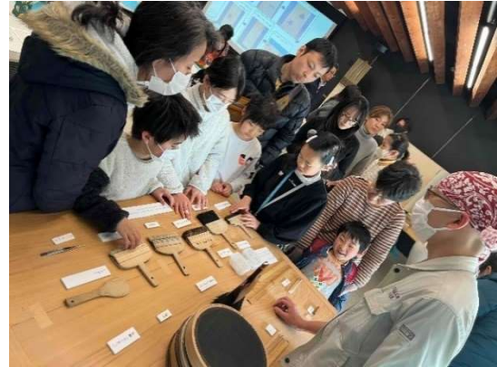
道具解説（龍谷ミュージアム）