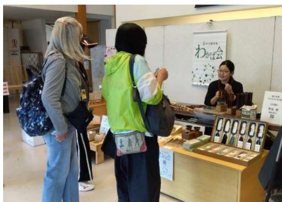
清水焼の郷まつり