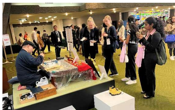
アジア太平洋肝臓学会 APASL 2024 Kyoto