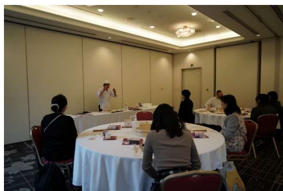
グランドプリンスホテル新高輪