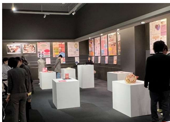
成果発表展（MOCAD ギャラリー）