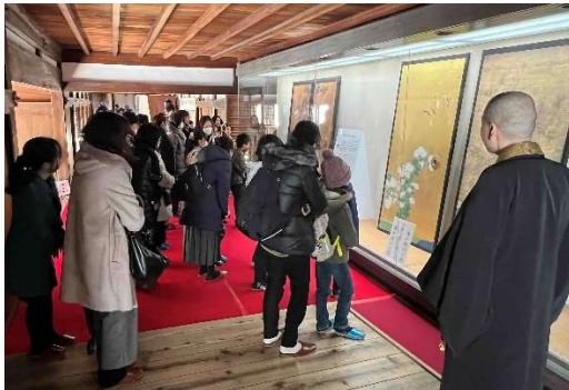
子どもの伝統体験教室と特別拝観（知恩院）