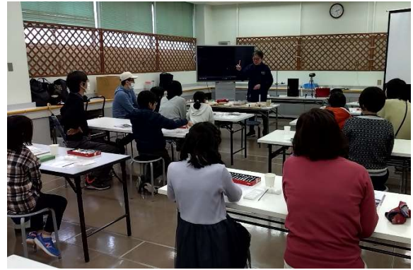
制作体験（青少年科学センター）