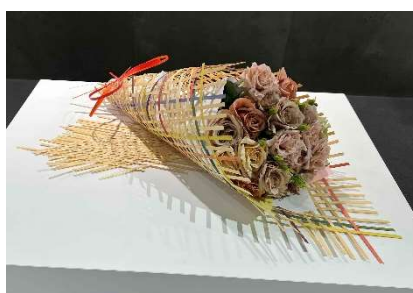
成果発表試作（竹工芸）