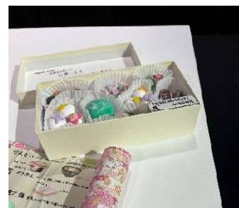
成果発表試作（京菓子）