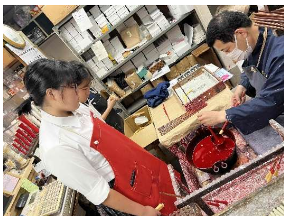
工房訪問でのインタビュー