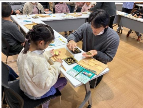
京都の伝統産業・伝統工芸から学ぶSDG s(さすてな京都)