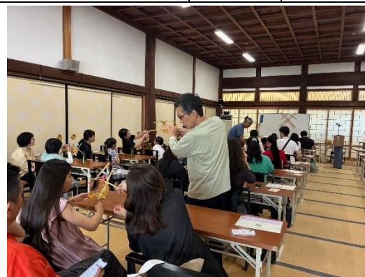
金戒光明寺制作体験（京銘竹・竹工芸品）