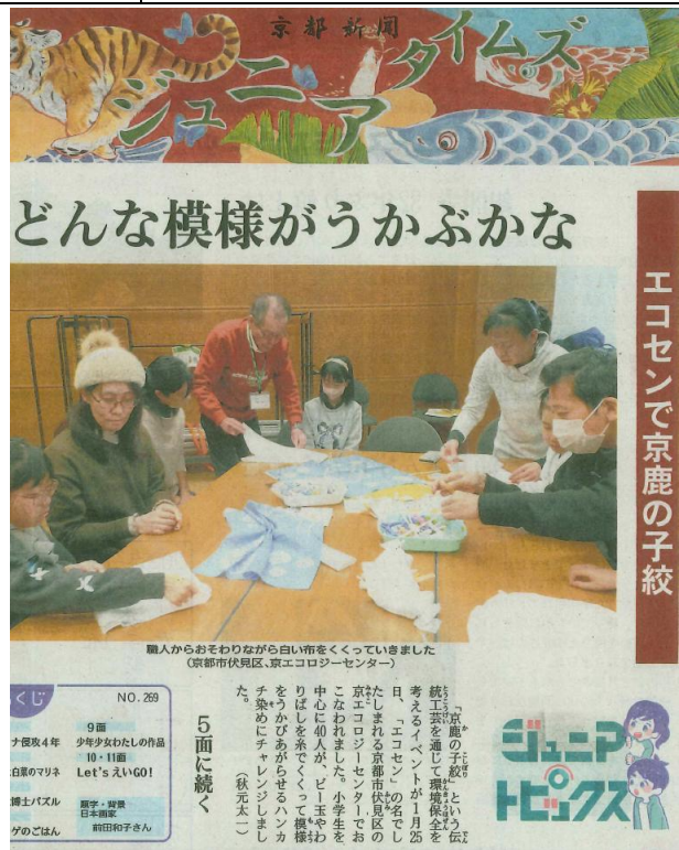
環境×京都の伝統産業・伝統工芸(京エコロジーセンター)