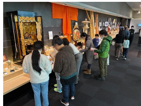
連続講座（クイズラリー）