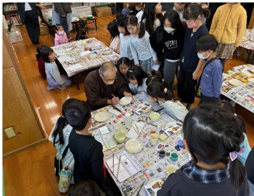
児童館制作体験（京焼・清水焼）