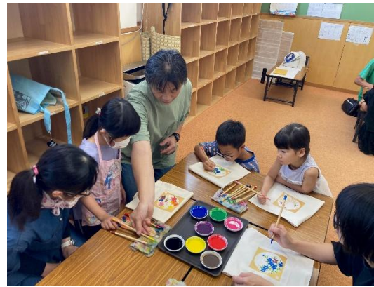
児童館制作体験（京友禅）