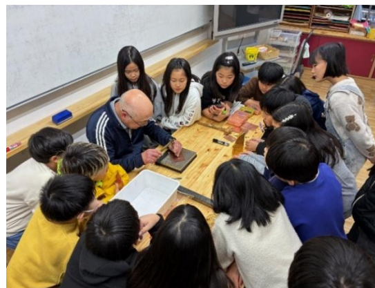
授業への講師派遣 (京都市立栄桜小中学校)