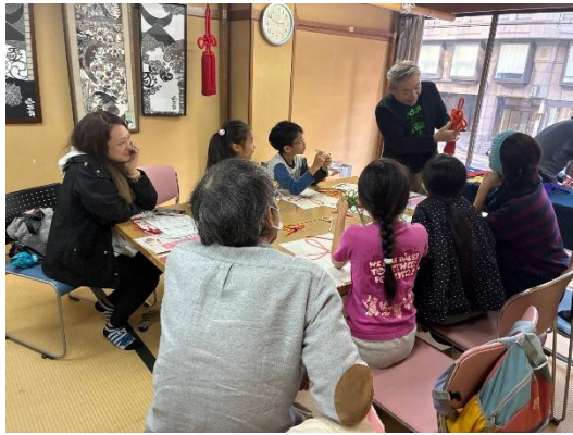
函谷鉾町会所制作体験（京房ひも）