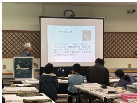
科学×京都の伝統産業・伝統工芸(京都市青少年科学センター)