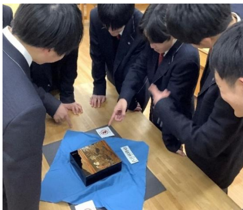
授業における工芸品の出張展示 (京都市立京都工学院高等学校)