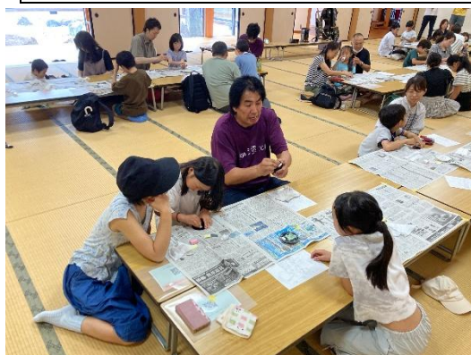
東福寺制作体験（京仏壇・京仏具）